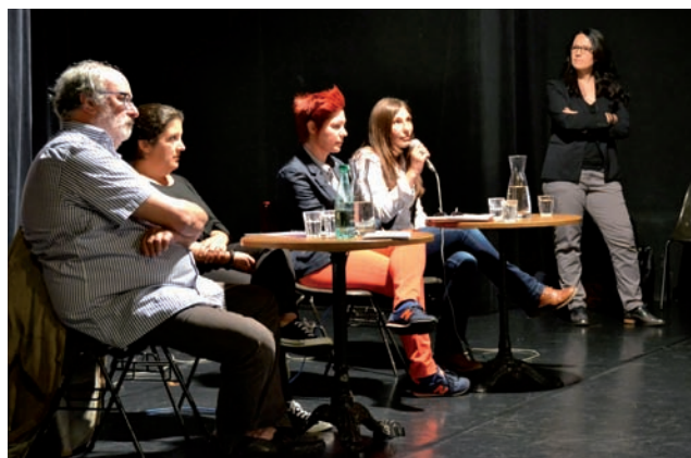
La table ronde