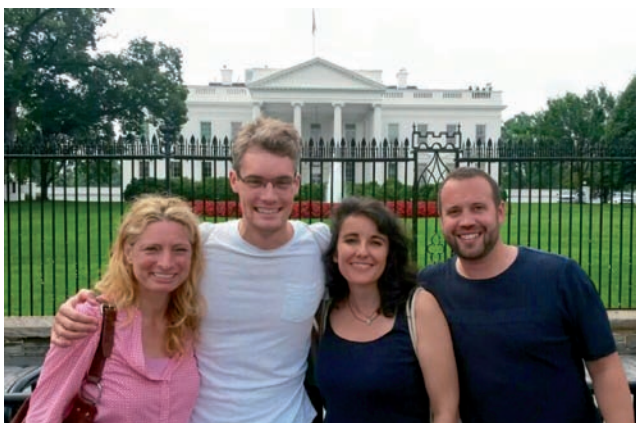
Devant la Maison-Blanche à Washington

Lors de leur voyage, la délégation s'est entretenue avec des politicien.ne.s tel.le.s que le Congressman Mark Pocan et avec Randy Berry, Envoyé Spécial des Etats-Unis pour les questions LGBT. Elle a échangé avec des représentant.e.s d'associations telles que Equality Maryland, Human Rights Campaign, Family Equality Council ou encore PFLAG (Parents, familles, ami.e.s et allié.e.s des personnes LGBT) et dialogué avec des représentant.e.s d'institutions religieuses telles que Mormons Building Bridges. Les expériences vécues par les Etats-Unis ont fourni à la délégation suisse des apports précieux et ont permis une mobilisation des savoirs et un échange de bonnes pratiques, qui peuvent être adoptés pour prévenir et lutter contre l'homophobie et la transphobie et renforcer les droits des personnes LGBT en Suisse.