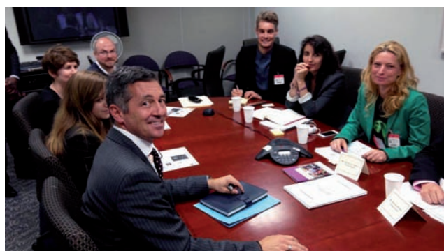
Randy Berry, Special Envoy for the Human Rights of LGBTIQ Persons aux Etats-Unis