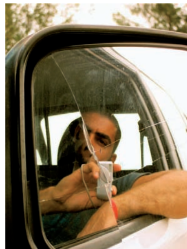
Exposition «Les Condamnés»