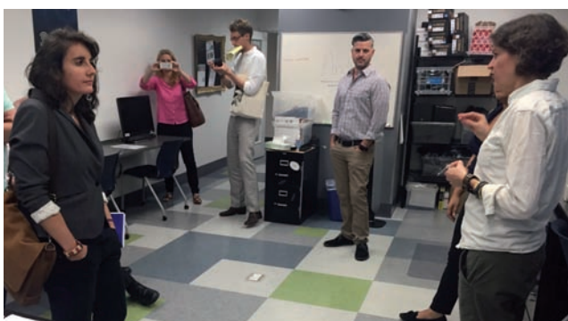
Au Ali Forney Center à New York, un refuge pour les jeunes LGBT qui se retrouvent à la rue ou en grande précarité. Ils / elles peuvent y passer de 3 mois à 2 ans selon leurs besoins. 40% des jeunes qui dorment dans la rue à New York sont des jeunes LGBT, venu.e.s de tout le pays