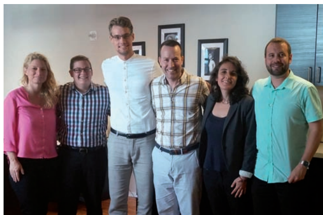
Au Transgender Legal Defence and Education Fund, New York, qui défend les droits des personnes trans* et établit des partenariats avec des avocat.e.s prêt.e.s à changer les papiers des personnes trans* bénévolement